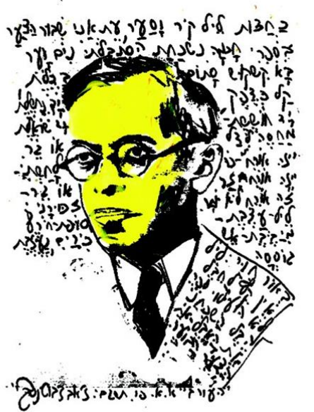
דיאלוג וקשרי חברות עם סופרים ומשוררים חיים או מתים. מתוך התערוכה: לאה גולדברג (למעלה), סמיח אליקאסם וזאב ז'בוטינסקי